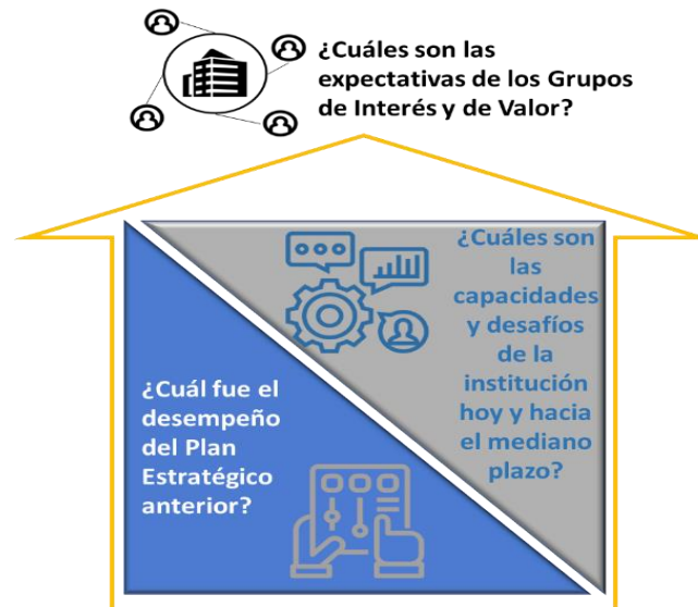
Ilustración 2 Estructura del Diagnóstico